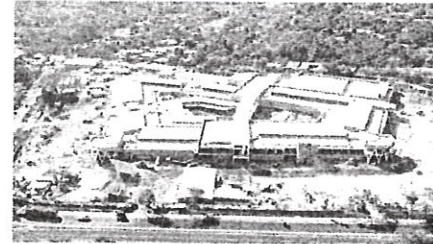
Estado de la Construcción