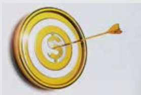
OBJETIVO DEL INVERSIONISTA

Para seleccionar la mejor opción de inversión debe considerar los siguientes aspectos: