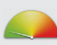
AVERSIÓN AL RIESGO