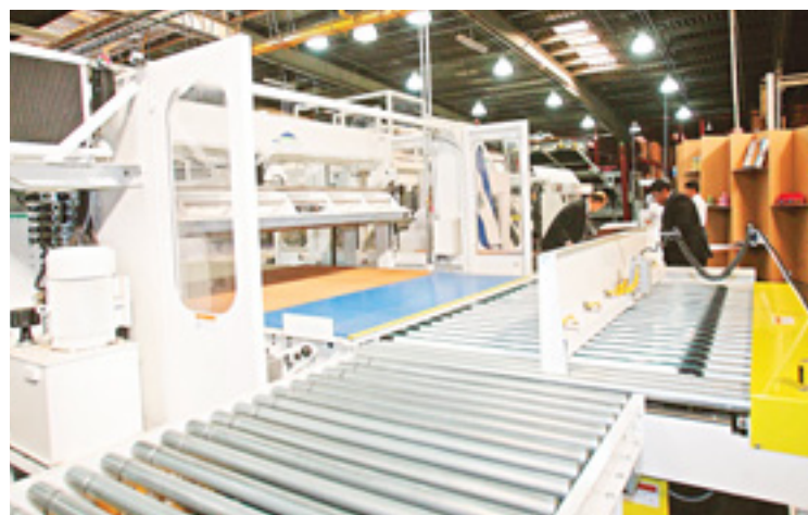
Regional. Sigma Q posee 10 plantas en Centroamérica. Un 80 % de la producción hecha en El Salvador es exportada hacia mercados como Europa.

anual fija del 7 %; el tramo B, ascendió a $2.7 millones y su plazo es de siete años. En este caso la tasa de interés fue de 6.5 %. La emisión fue calificada por las agencias Equilibrium y PCR como AA-, según explicó José Carlos Bonilla, director ejecutivo de Ricorp Titularizadora, entidad que