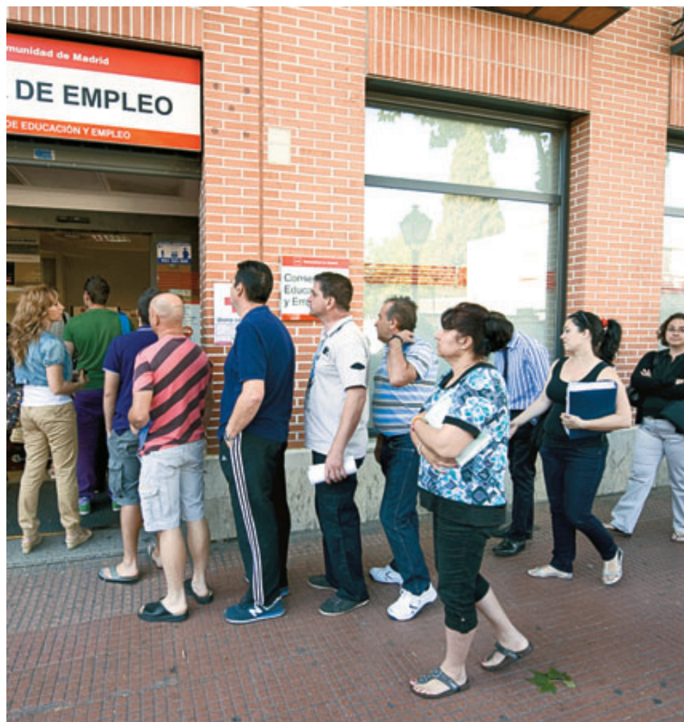
El desempleo y la pobreza serán fenómenos crecientes en países en desarrollo.

El documento del Foro Económico Mundial señala que el desempleo estructural y