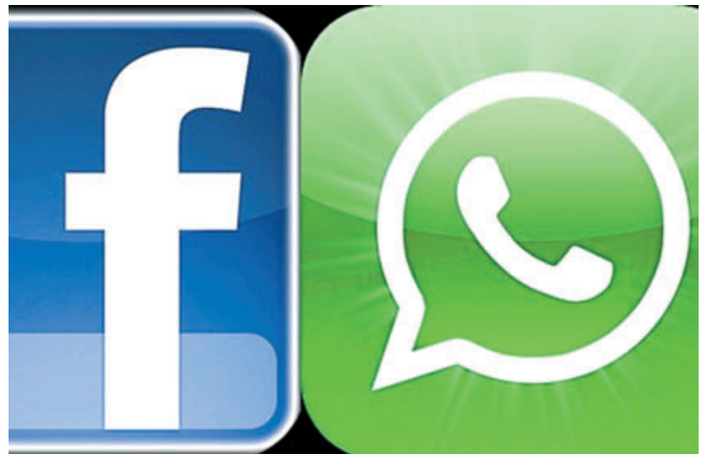
WhatsApp seguirá funcionando normal e independiente, y sin anuncios.