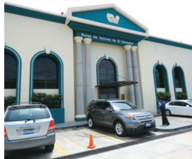
Los bancos han advertido que pequeños empresarios y usuarios serán los más afectados con una reforma fiscal.

El documento compara el desempeño de 17 países entre sí y en relación con el promedio de la OCDE, en 31 áreas específicas. En cuanto al nivel de desigualdad salarial en el sector público regional, muestra que los funcionarios de mayor rango ganan 11 veces el salario promedio del personal, en comparación con las seis veces de los países de la OCDE y que sectores públicos pequeños, que representan el 10.7% de la fuerza laboral en comparación con el 15.3 % de promedio de la OCDE. —EFE