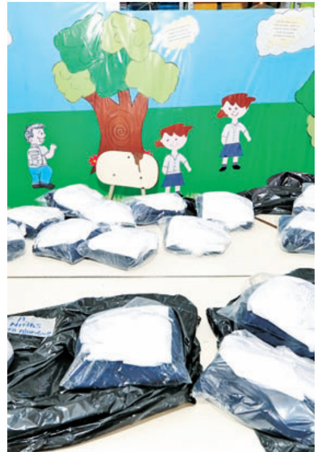
Los asalariados independientes no reciben el trato de igualdad tributaria.

Cuando el país tenía “grado de inversión” el diferencial era de 200 puntos básicos, pero en 2009, cuando este grado se perdió, el diferencial subió hasta 400 puntos, con lo que ahora paga más intereses por